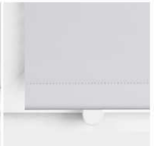
fixierte Stahlschiene mittels Klemmträger