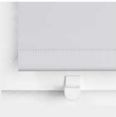
Klemmträger mit Magnet am Rahmen