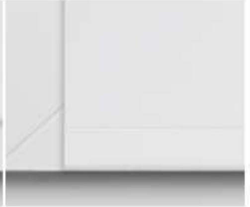
fixierte Stahlschiene mittels Flachmagnet