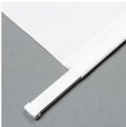
Stahlschiene im Saum