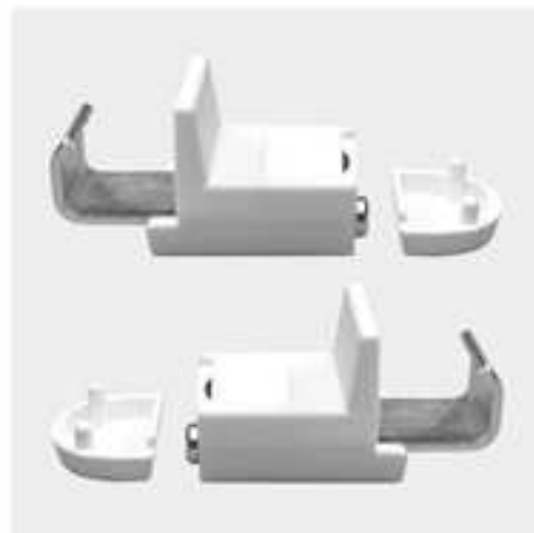
Klemmträger mit Magnet