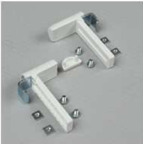
Klemmträger Langloch lang