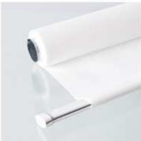
Stahlschiene im Saum