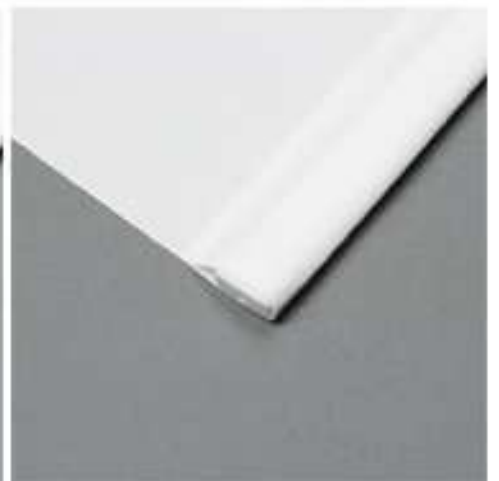
Stahlschiene im Saum