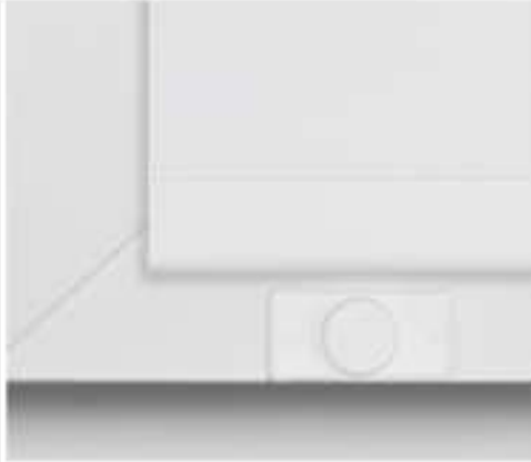
Flachmagneten am Rahmen festgeklebt