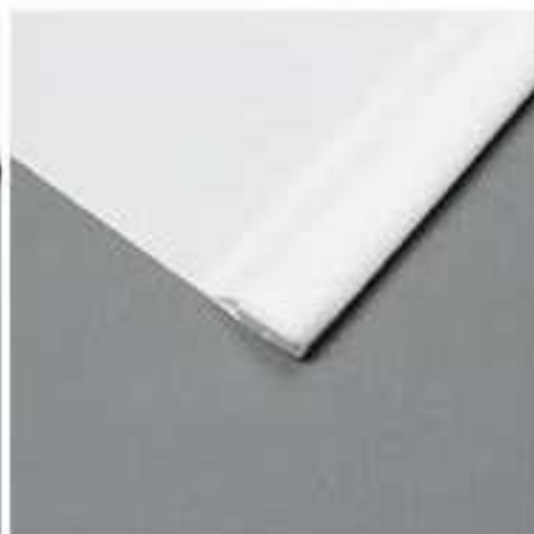
Stahlschiene im Saum