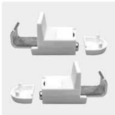
Klemmträger mit Magnet