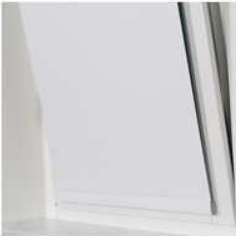
fixierte Stahlschiene an einem Kipfenster