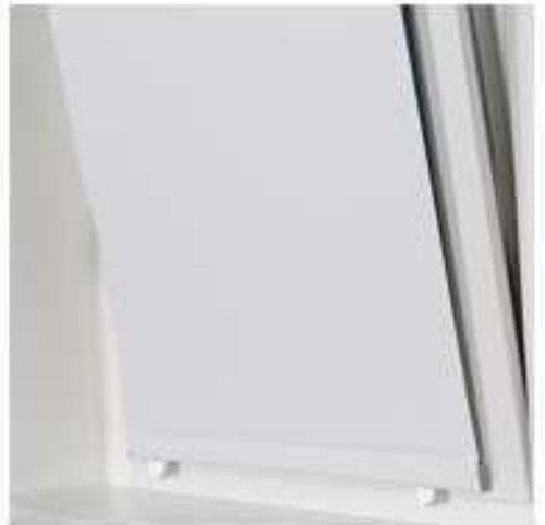
fixierte Stahlschiene an einem Kipfenster