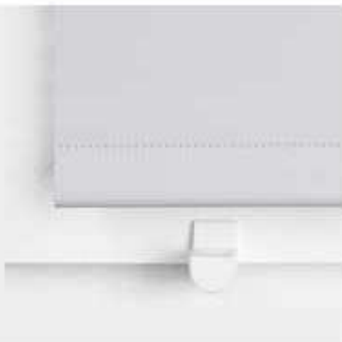
Klemmträger mit Magnet am Rahmen