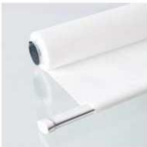
Stahlschiene im Saum