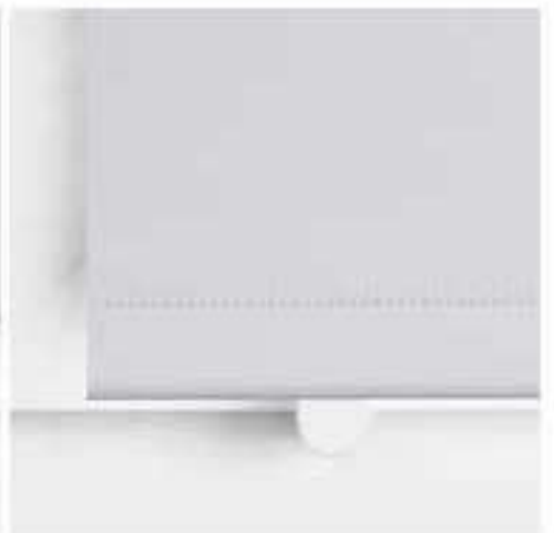
fixierte Stahlschiene mittels Klemmträger